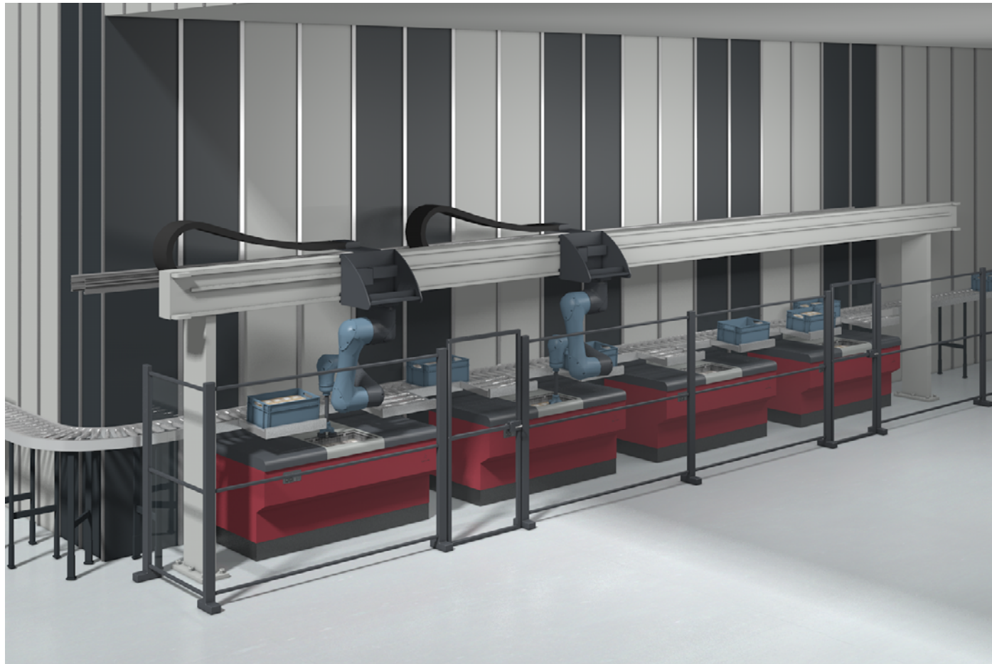
Automatisierte Lösung mit Pick and Place Robotern in der Kommissionierung