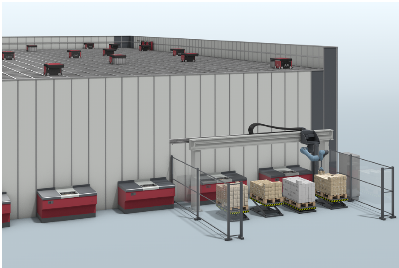
Automatisierte Lösung mit Pick and Place Robotern in der (De-)Palettierung