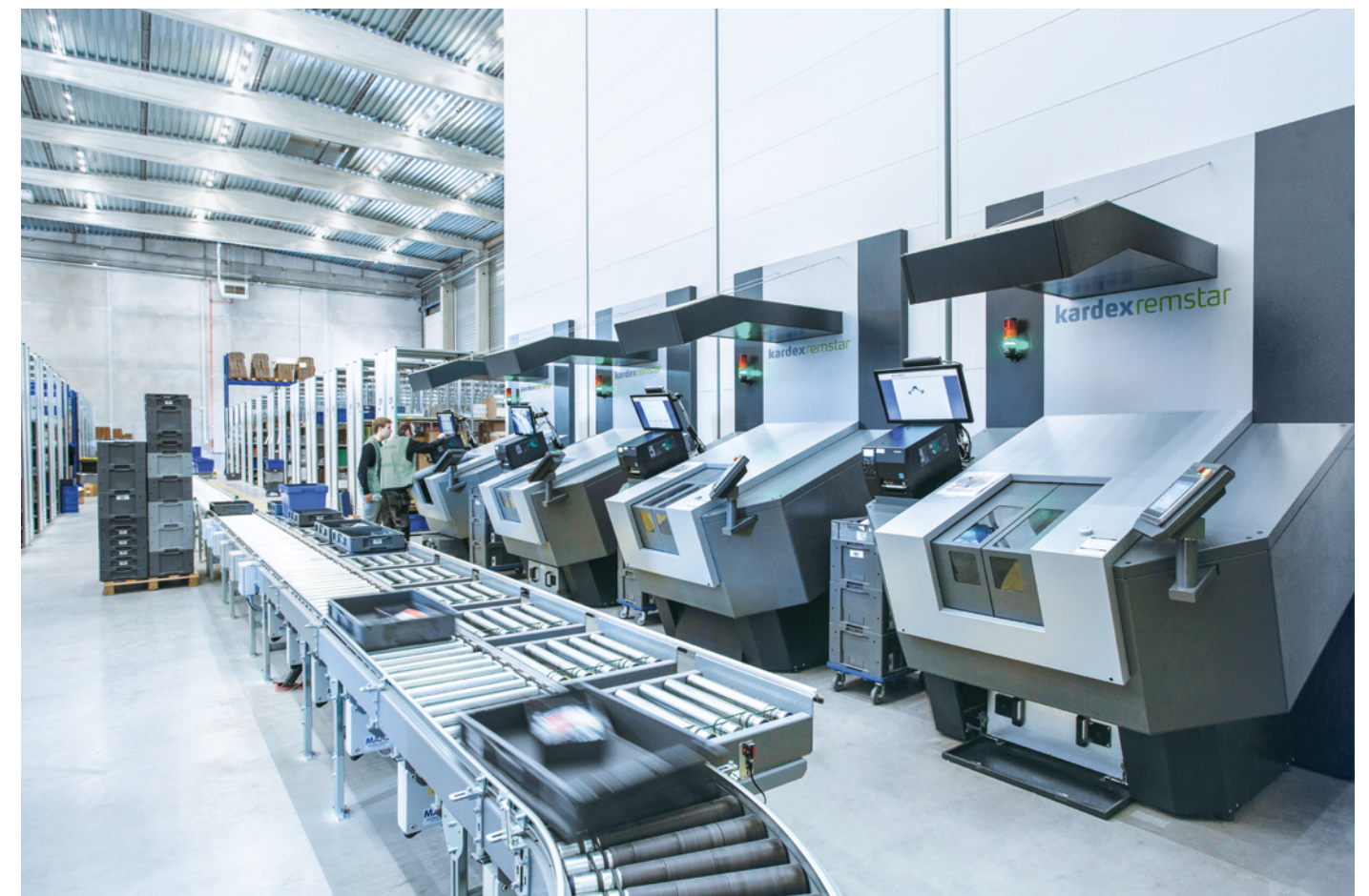
Kommissionierung mit Drehtischen und Fördertechnik mit Ablageplätzen

Weitere Optionen und Lagerumgebungen mit Klimatisierung, Brandschutz oder ESD-Ausführung sind ebenfalls verfügbar.