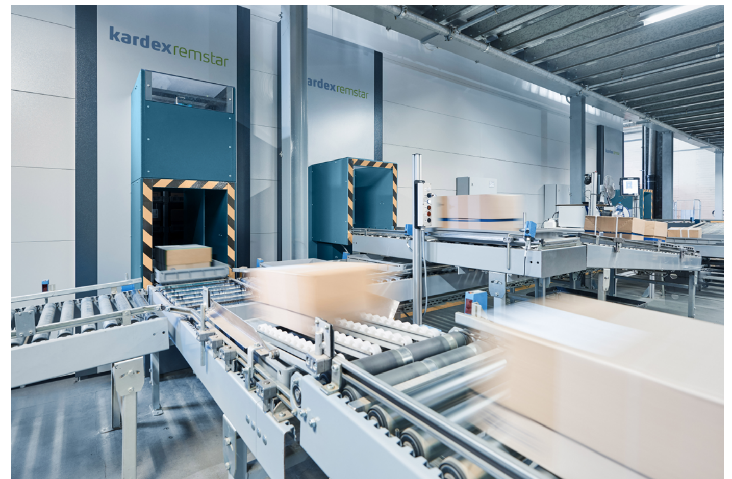
Auftragskonsolidierung mit automatischer Fördertechnikanbindung