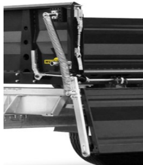
Seitenbordwand mit Federentlastung abklappbar, optional