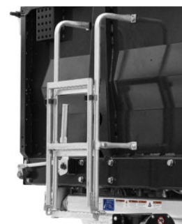
Aufstiegsleiter an der Stirnwand, optional

*Sicherheitshinweis! Die Verwendung der Anhänger darf nur unter ausdrücklicher Beachtung aller straßenverkehrsrechtlichen, berufsgenossenschaftlichen und ladungssicherungstechnischen Vorschriften erfolgen. Alle Angaben ohne Gewähr! Für Irrtümer und Druckfehler wird keine Haftung übernommen. Technische Änderungen vorbehalten. Alle Maßangaben sind ca. Werte und beziehen sich auf das Serienfahrzeug ohne Zubehör. Zusatzausstattung verändert das Eigengewicht und die Nutzlast. Abbildungen ähnlich, können aufpreispflichtiges Zubehör enthalten.