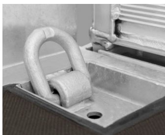
Zurpunkte 6t im Brückenboden versenkt