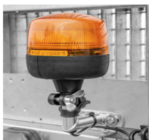
Rundumleuchte an der Rampe, optional