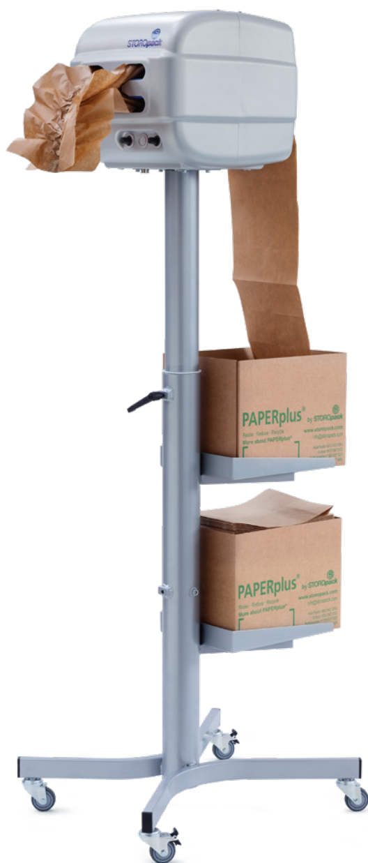
PAPERplus® Papillon Floor Stand Model

▶ Vídeo del producto PAPERplus® Papillon: www.storopack.es/paperplus-papillon-video