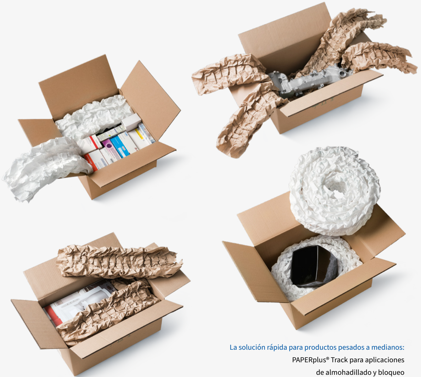
La solución rápida para productos pesados a medianos: PAPERplus® Track para aplicaciones de almohadillado y bloqueo