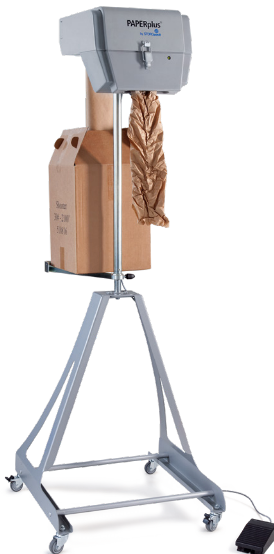
PAPERplus® Shooter Floor Stand Model