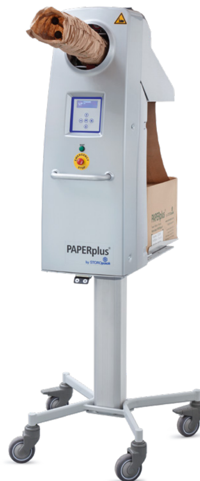
PAPERplus® Chevron 3