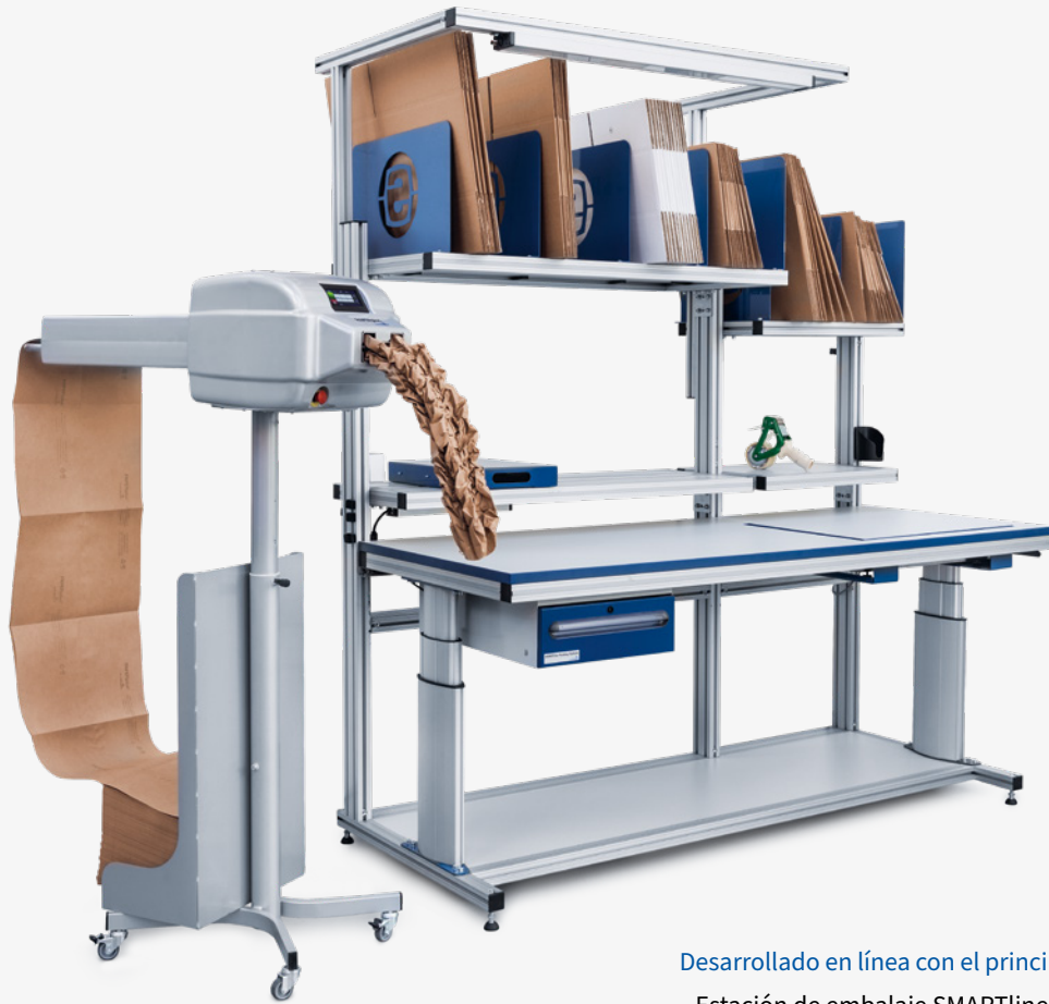
Desarrollado en línea con el principio Working Comfort®: Estación de embalaje SMARTline con PAPERplus® Track