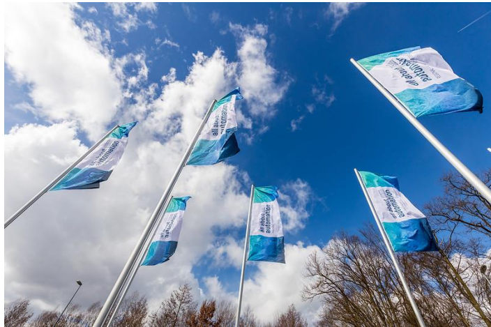
Die Fahnen der all about automation wehen 2022 auch in Zürich und Namur.

ist. Mit der Energie und Internationalität der gesamten Easyfairs-Gruppe ist es folgerichtig, dass wir nun das Erfolgsmodell einer vertriebsunterstützenden Automatisierungsmesse in die Schweiz und nach Belgien bringen. Die dortigen Messen werden in Kooperation mit den im jeweiligen Land ansässigen lokalen Easyfairs Kollegen und Partnern realisiert.“