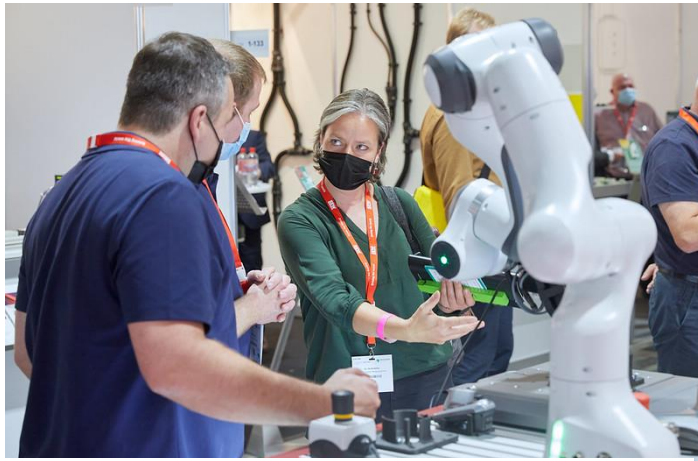
Konkrete Fragen direkt erklärt. Hier auf der all about automation im September 2021 in Chemnitz.

Die all about automation zeichnet sich durch ein Messekonzept aus, dass es den Ausstellern einfach macht, sich zu präsentieren. Primäres Ziel ist die Unterstützung des Fachvertriebs. Anbieter und Anwender kommen auf den Messen - von Ingenieur zu Ingenieur - miteinander ins Gespräch. In angenehmer Atmosphäre und mit ausreichend Zeit werden konkrete