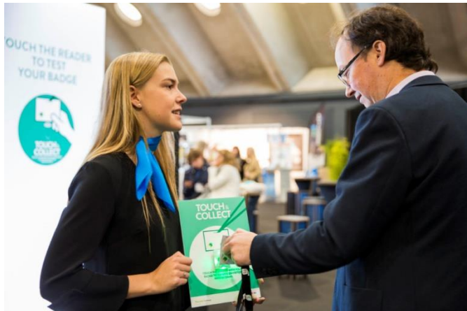
Kontaktloser Austausch von Daten und Informationen über das Smart Badge. Ab 2021 für alle Aussteller und Besucher der all about automation.

Juni 2021 in Essen und am 22. und 23. September 2021 in Chemnitz. Die regionalen Besuchereinzugsgebiete und das Systemstandkonzept ermöglichen es den Ausstellern gezielt für sie attraktive Regionen auszuwählen, die Messeorganisation zu vereinfachen und mit einem überschaubaren Budget den Regionalvertrieb effizient zu unterstützen.