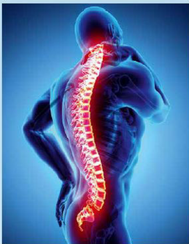
Ergonomische Geräte schützen vor schwerwiegenden Rückenproblemen.

Deshalb rechnet die Weltgesundheitsorganisation (WHO) aufgrund des demographischen Wandels innerhalb der kommenden 20 Jahre mit einer Verdoppelung der Krankheitsfälle. Meist treten Rückenschmerzen auf. MSE zählt zu den häufigsten Ursachen von Frühverrentungen. In Deutschland lassen sich mehr als ein Viertel aller Krankheitstage der Arbeitnehmer darauf zurückführen. Entsprechend hoch sind die entstehenden betriebs- und volkswirtschaftlichen Kosten - sie liegen bei etwa 15 bis 20 Mrd. Euro im Jahr.