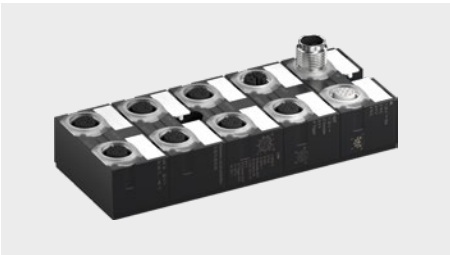
Breakout Block Art.-Nr. 277418