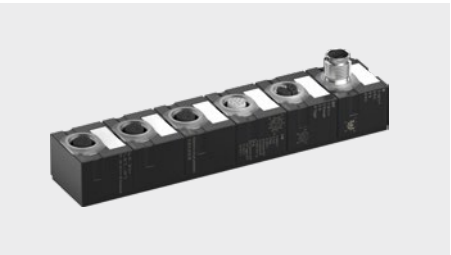
Single Reader Block Art.-Nr. 277417