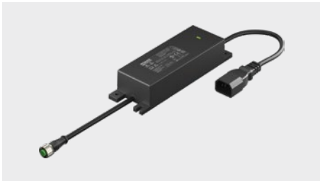
IP67 Industrial Power Supply Art.-Nr. 9000-10112-0605010