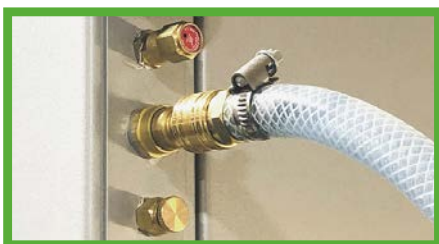
Druckluftanschluss zur automatischen Abreinigung

Lieferung inklusive Zellenradschleuse, Füllstandsmelder, Blitzleuchte Hupe Combi und Absaugrohrleitung.