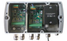
3 Neigungssensor in Klemmkasten