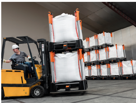
Sichere interne ánd