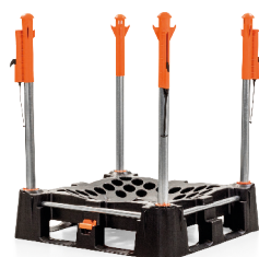
Das komplette Indus Neva System