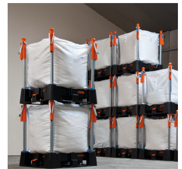
Effiziente Lagerung (max. 4 hoch x 1.500 kg.)