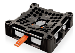
Das Basisgestell Indus Neva mit geöffneten Schieber für (dosierte) Entleerung