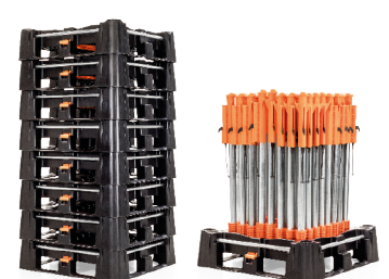
Reduziertes Volumen bei Lagerung leerer