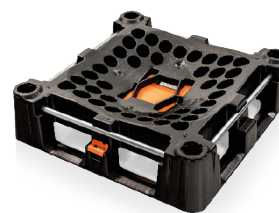
Das Basisgestell Indus Neva mit geschlossenem Schieber