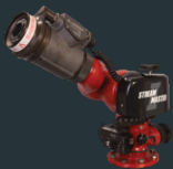
Akron Brass Streammaster II

Die spezielle PYROsmart® Löschartikellsoftware macht das gezielte automatische Löschen ganz einfach möglich und unterstützt folgende Löschwerfer-Hersteller/Modelle: