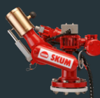
Johnson Control Skum-Monitor