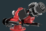
Alco APF 2.5-DC EVO