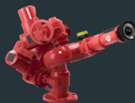
Alco APF 3C AC