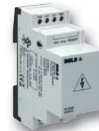
Vorschaltgerät RL 5898