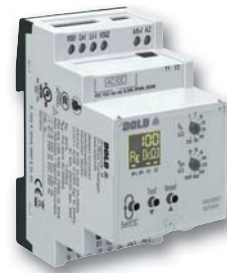
Isolationswächter RN 5897/010