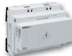
Vorschaltgerät RR 5898