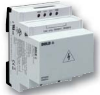
Vorschaltgerät RP 5898