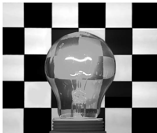
Bild 3: Im HDR Modus wird auch das Innere der Glühbirne detailliert abgebildet.

Im HDRModus wird die Szene mit mehreren Belichtungszeiten aufgenommen. Ausgeklügelte Algorithmen erzeugen daraus ein einziges ausgeglichenes Bild. Dadurch wird das Überstrahlen verhindert. Im Bild bleiben sowohl die hellen als auch die dunklen Details erhalten. Auf diese Weise kann man sogar das Innenleben der Glühbirne inklusive des glühenden Wendels und dessen Reflexion am Glaskörper, sowie das dahinter liegende Schachbrettmuster klar erkennen.