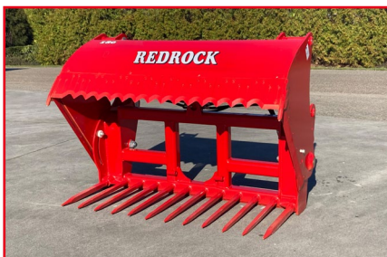
Alligator serie met tanden, snijhoogte 85/100/130 cm

De standaarduitrusting van de Redrock kuilhappers is zeer compleet. Zo worden de machines met hefmast uitgevoerd met een hydraulische afschuiver en handbediend ventielblok. Een enkelwerkende hydrauliekaansluiting met een vrije retour is voldoende. Een snelkoppelstang voor gemakkelijke aanbouw aan de trekker is tevens aanwezig.