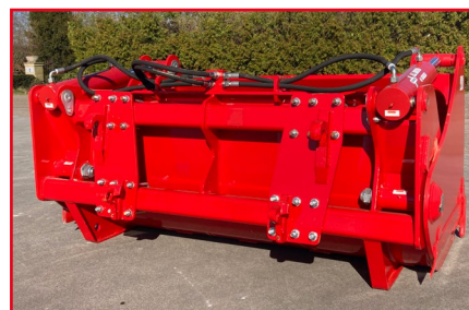
Alle soorten aanbouwdelen mogelijk, bijvoorbeeld Euro aanbouwdelen