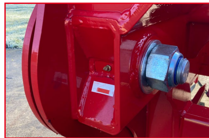
Stabiele draaipunten met \varnothing tot 60 mm bij 130-serie