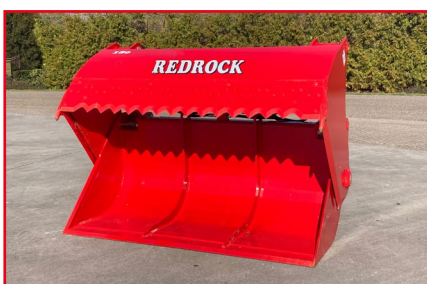
Allround serie met gesloten bodem, snijhoogte 85/100/130 cm