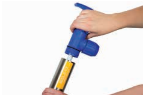
Stap 1 Schroef het bovenste stuk los.