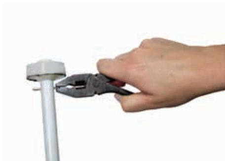
Stap 3 Verwijder de splitpen van de pompstang en vervang de pompstang, pompstangring of met teflon beklede ring. Voor het vervangen van de pompstangring eerst de pompstangkoppeling losschroeven.