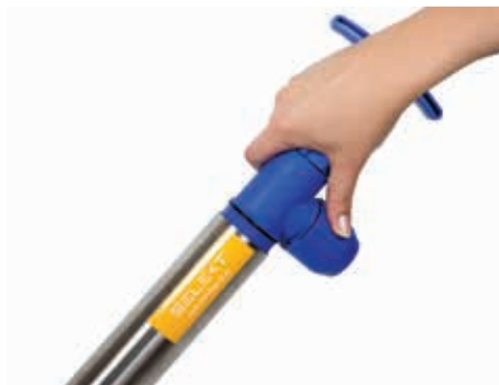
Stap 5 Monteer de pomp weer. Draai het bovenstuk niet te strak aan, dit kan leiden tot verzwakking.