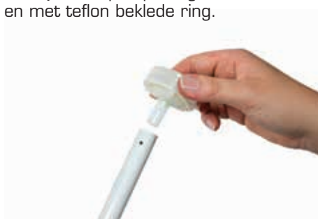
Stap 4 Monteer de met teflon beklede ring en plaats een nieuwe splitpen.