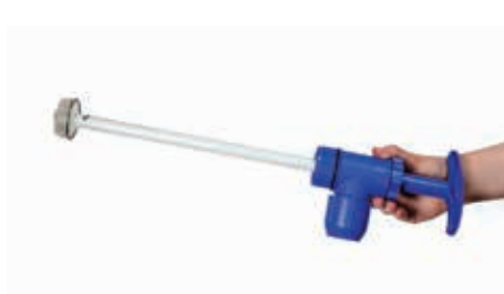
Stap 2 Verwijder de pompstang met bovenstuk en met teflon beklede ring.