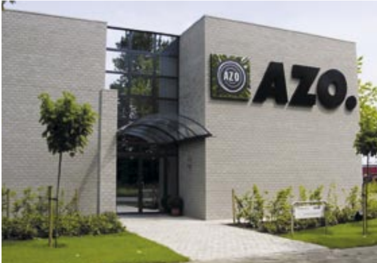
Le centre de service client d'AZO situé à Anvers est équipé d'une salle d'essais et d'un espace de séminaire ultra modernes.