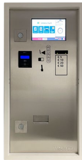
CP450 wordt aan de muur bevestigd en is 0,51m breed op 1m hoog.

Met de afzonderlijke PLC sturing kan u live alle instellingen wijzigen. Zo kan u de openingsuren van uw wassalon instellen waarna de deur en verlichting automatisch gestuurd worden. Zelfs uw prijzen kunnen remote aangepast worden, of u kan van op afstand een sirene laten afgaan.