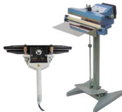
Soldantes con tenaza