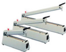
Soldantes con corte