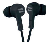
ÉCOUTEURS ÉTANCHES IPX6