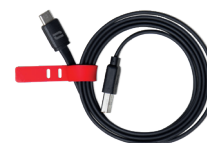
CABLE USB-A / USB-C