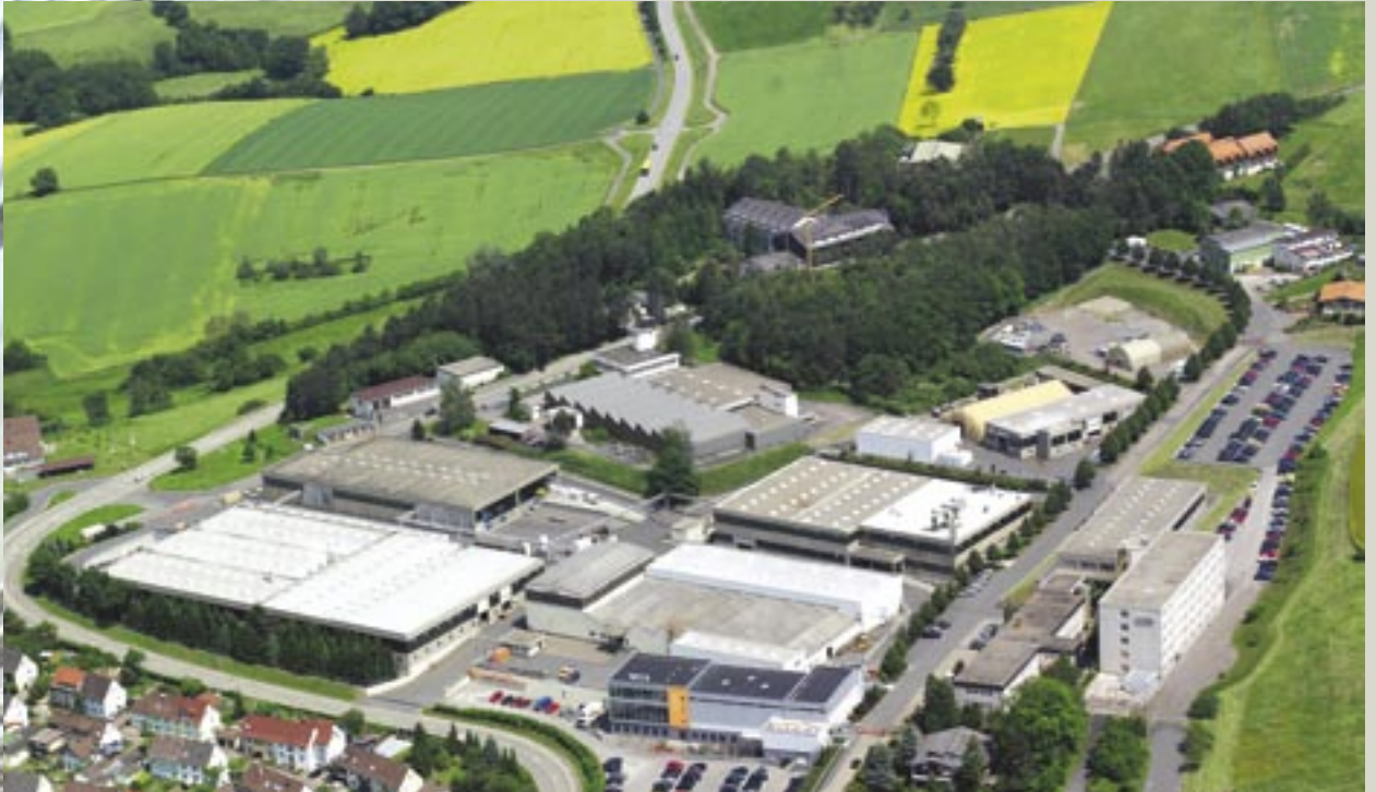
AZO-Osterburken met op de voorgrond het nieuwe technologiecentrum.