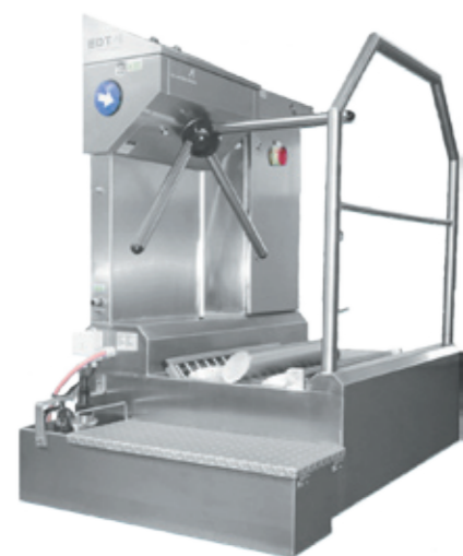
DSR 10 mini/ DKE