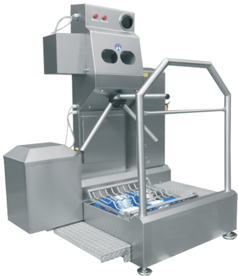
DSR 1000 mini