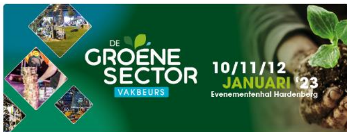
De Groene Sector Vakbeurs 2023 Facebook Social Header