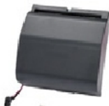
Automatisches Schneidezubehör für i6100 Etikettendrucker für die Industrie