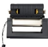
Abziehzubehör für i6100 Etikettendrucker für die Industrie