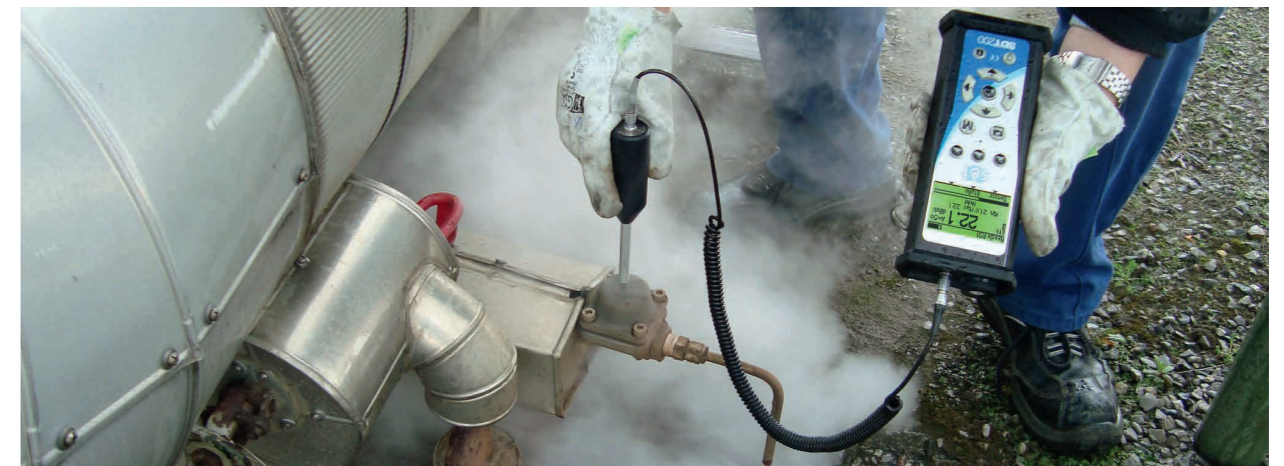
Kondensatableiterprüfung mit SDT 200

Beide Messsysteme helfen Ihre Energiekosten zu senken und sind zwei wichtige Bausteine auf dem Weg zur ISO 500001!