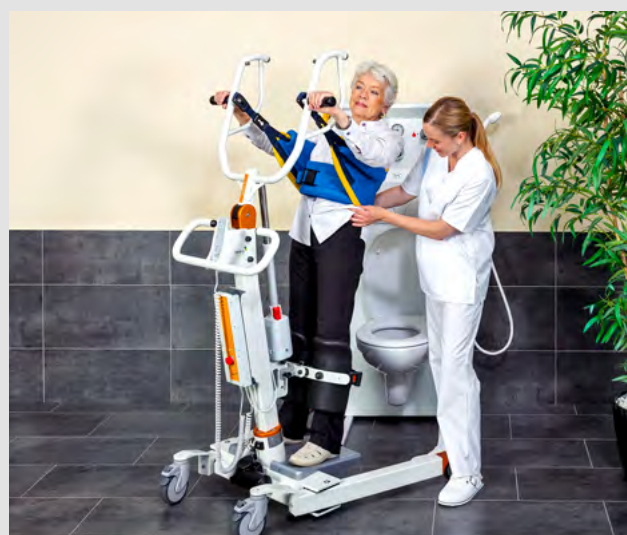
Idéal pour les visites aux toilettes et l'hygiène facile de la zone assise