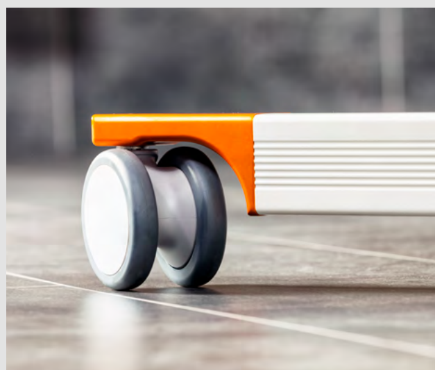
Roues pivotantes haut de gamme, entièrement fermées, pour une mobilité optimale