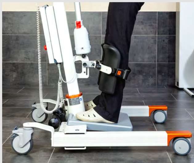
Repose-jambes réglables en hauteur et flexibles pour un confort optimal