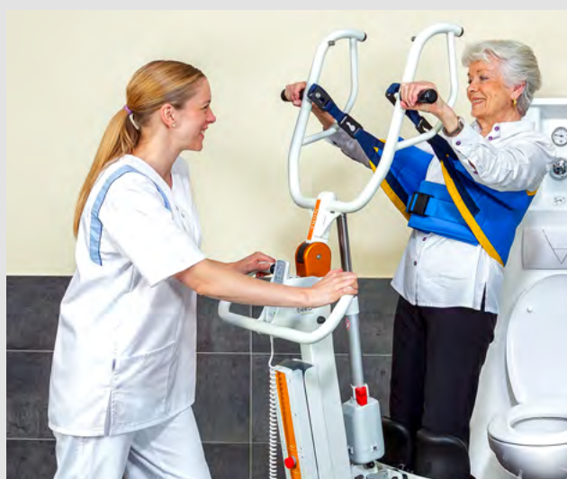
Deux paires de poignées pour une prise en main optimal