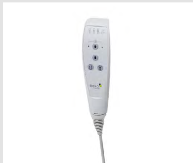
Une télécommande simple et claire : toutes les fonctions du lève-personne actif et le niveau de batterie en un coup d'œil