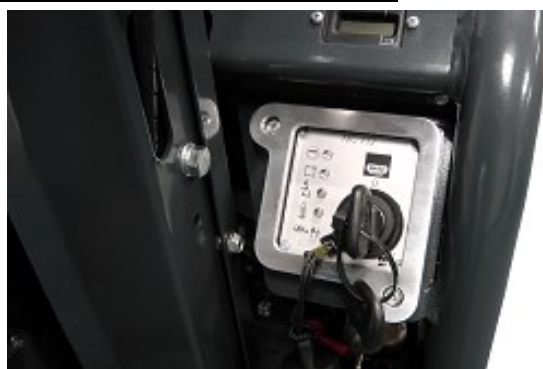
Diesel met elektrische starter.