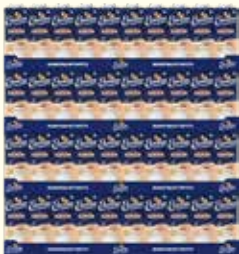
Elovena Kaurajuoma kahviin, PL 320 x 1 l ME: 320