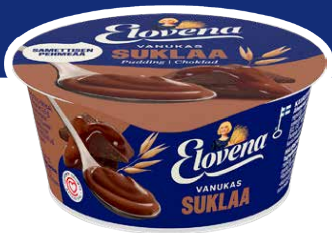
19100 Elovena Vanukas Suklaa 135 g, ME 6, ME/lava 288

Suklaan tulokset yhtä hyvät kuin Jacky Makupalan!*