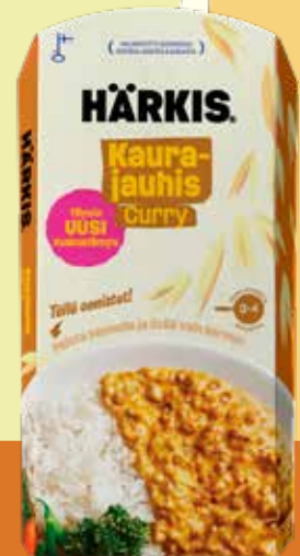
20202 Härkis Kaurajauhis Curry 225g

Ainesosat: Vesi, gluteeniton KAURA 15%, herneproteiini, härkäpapuproteiini, mausteet (sipuli, chili, kurkuma, curry mausteos, paprika, valkosipuli, tomaatti, persilja), aromit, sokeri, suola.