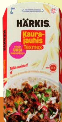
20201 Härkis Kaurajauhis Texmex 225g

Ainesosat: Vesi, gluteeniton KAURA 15%, herneproteiini, härkäpapuproteiini, mausteet (paprika, sipuli, tomaatti, valkosipuli, juustokumina, chili, korianteri, oregano), aromit, sokeri, suola, limeutejauhe, rapsiöljy.