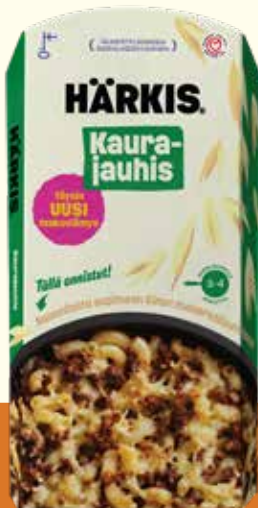
20200 Härkis Kaurajauhis 225g

Ainesosat: Vesi, gluteeniton KAURA 15%, herneproteiini, härkäpapuproteiini, mausteet (sipuli, paprika, valkosipuli, tomaatti, mustapippuri, cayenepippuri, basilika, oregano, maustepippuri), aromit, sokeri, suola.